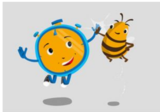
Maskottchen Stoppi mit Sabiene

2024 findet die dritte Bundesweite 72-Stunden-Aktion statt. Auch unsere Kirchengemeinden sind dabei!